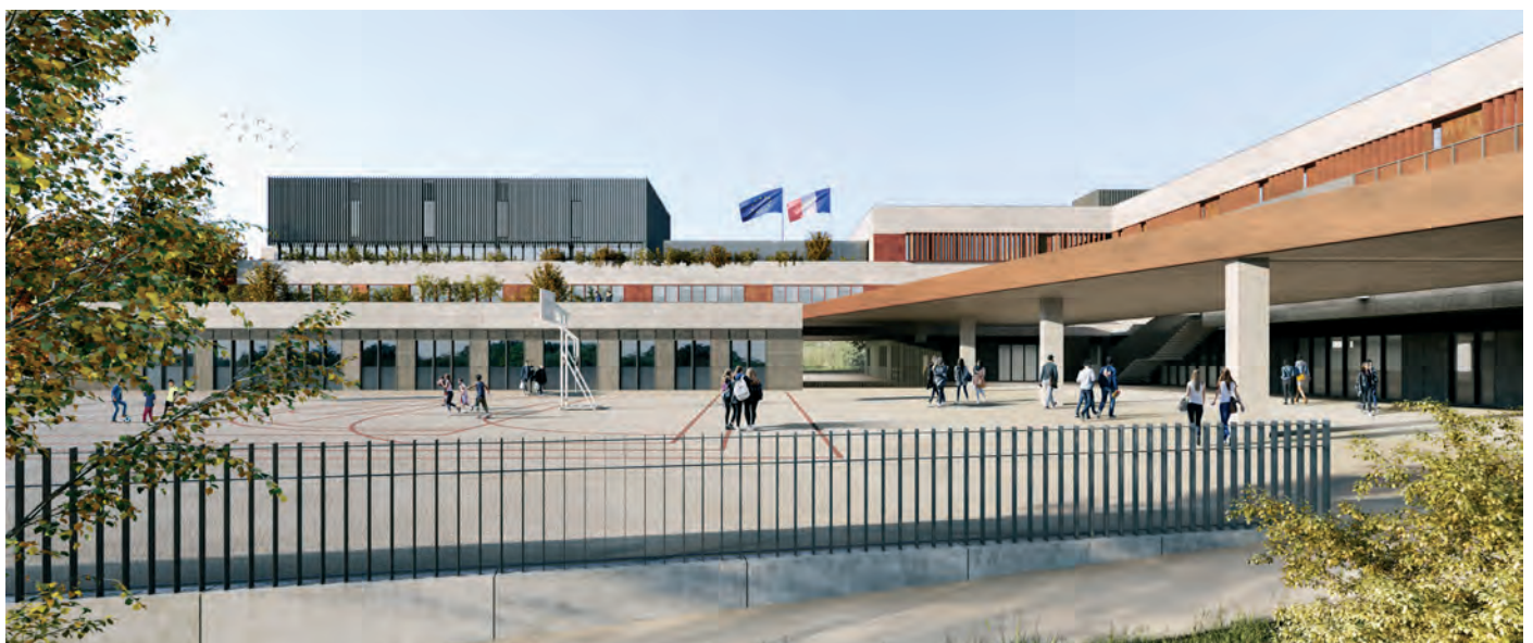
Perspective du futur collège Nelson-Mandela ©Valero Gadan & associé

Montant financé par le FS2i en 2020 : 3,4 M€