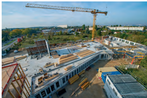
Chantier du futur collège Samuel-Paty

Montant financé par le FS2i en 2020 : 6,6 M€