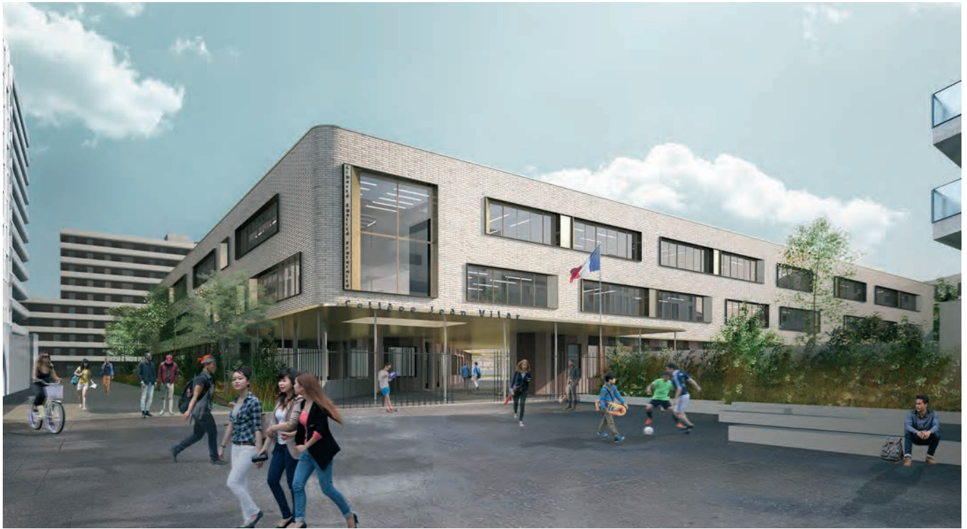
Perspective du collège Jean Vilar à La Courneuve (93)