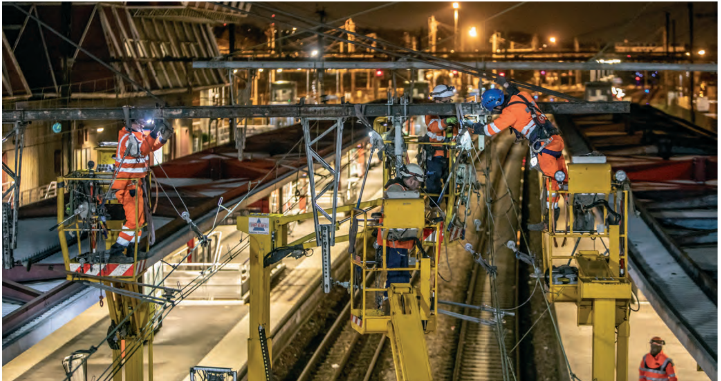
Essonne GPI Juvisy photo grutage