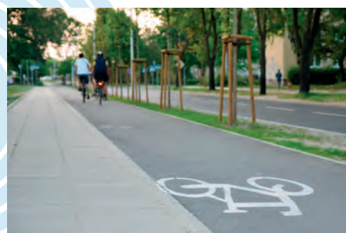
Plan vélo Val d'Oise