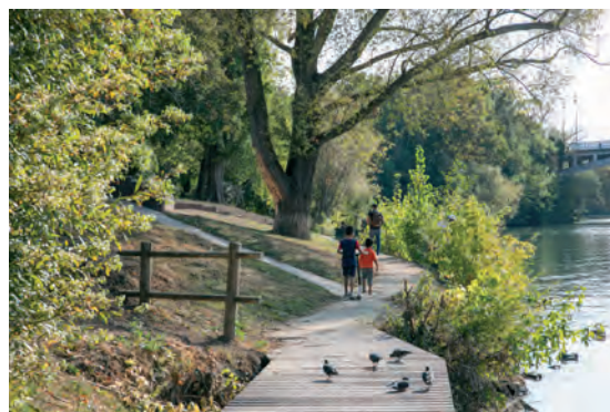
La Marne

Montant financé par le FS2i en 2020 : 80 000 €