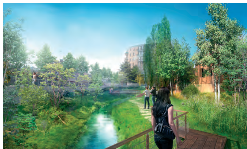
Perspective de la Division Leclerc ©Le Visiomatique

Montant financé par le FS2i en 2020 : 636 639 €