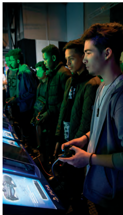
Essonne C-19 photo Evry Game ©Moïse Fournier (5)

Montant financé par le FS2i en 2020 : 1 M€