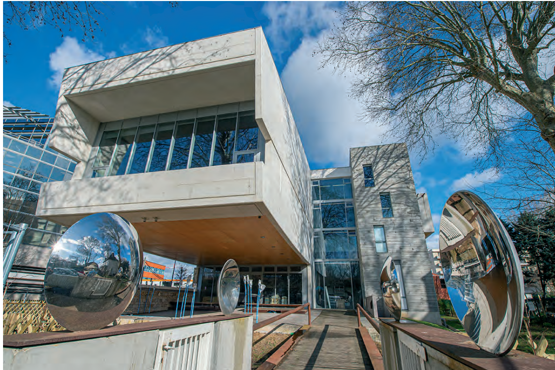
Musée de la Résistance nationale