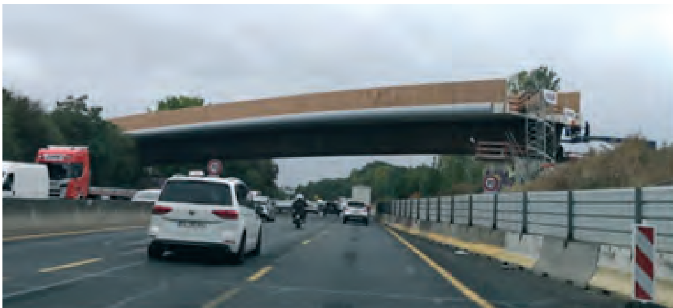
Tram 12 express. Aménagement du pont de Grigny et du pont de Ris-Orangis sur l'A6