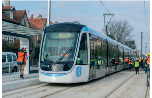
Tram 9

Montant financé par le FS2i en 2020 : 3,4 M €