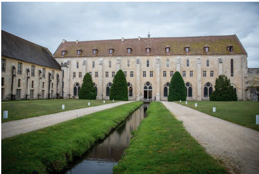
Abbaye de Royaumont

Montant financé par le FS2i en 2020 : 1 M€