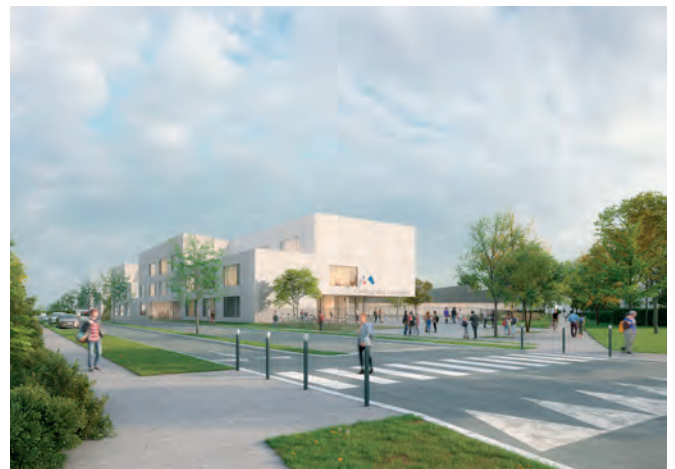
Nouveau Collège à Cergy credit Gaëtan Le Penhuel et Associés

Montant financé par le FS2i en 2020 : 3 M€