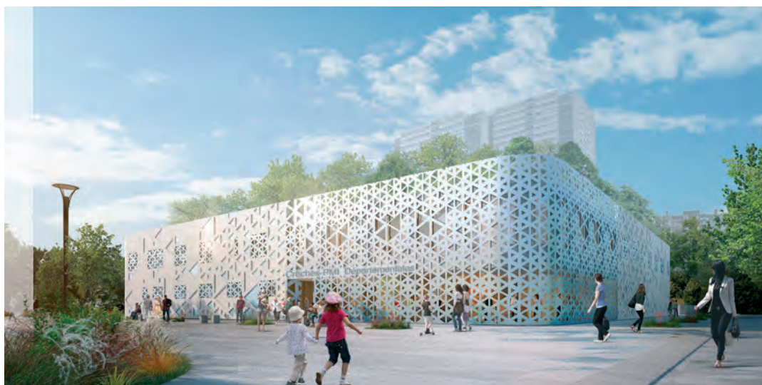
Perspective du futur équipement Les Larris ©Illuminens

Montant financé par le FS2i en 2020 : 83 333 €