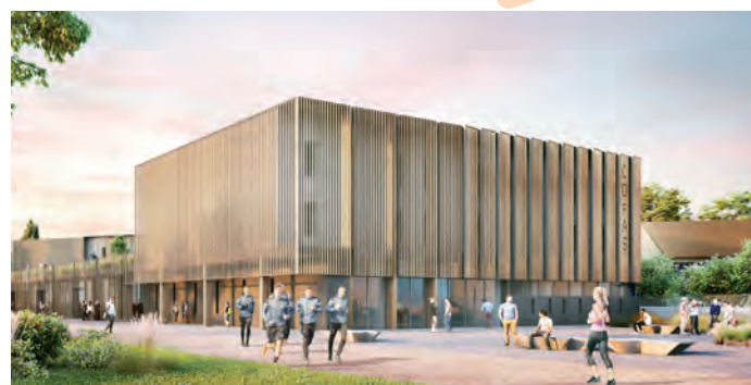
Extension du cdfas - credit Atelier 234

Fréquenté par plus de 206 000 utilisateurs par an, équipement d'excellence sportive avec 3 pôles espoirs régionaux, le CDFAS offre aussi des services adaptés d'hébergement et de restauration. Le Département du Val d'Oise a décidé son extension pour améliorer son fonctionnement quotidien, et en vue de la préparation des Jeux Olympiques et Paralympiques de Paris 2024. Cette opération d'extension consiste à construire un bâtiment neuf regroupant la restauration et l'hébergement porté à 200 lits. En 2020, les études ont été réalisées et l'architecte (Atelier