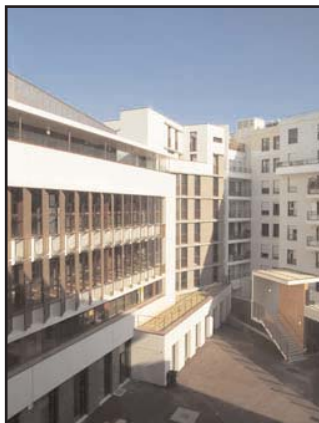
SEM 92 / Eric Sempé

Ce collège répond aux 14 cibles de la démarche Haute Qualité Environnementale (HQE).